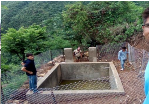
जुमाराङ्गसी स्मार्ट कृषि गाउँ कार्यक परिवर्तन गा.पा., रोल्पाका गतिविधिका झलक