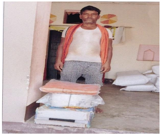
समयमाइ स्मार्ट कृषि गाउँ सञ्चालक समिति मर्चवारी गा.पा.-१ रुपन्देहीका कृषकलापहरुको झलकहरु