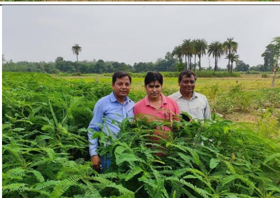
स्मार्ट कृषि गाउँ कार्यक्रम कार्यान्वयन समिति, गैडहवा गा.पा.-७, बगरदहिया, रुपन्देहीका झलकहरु