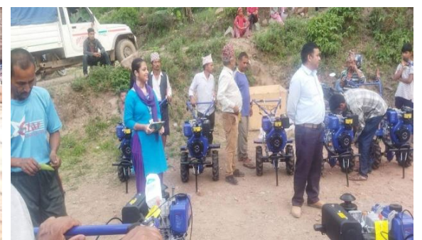
मर्काबाड स्मार्ट कृषि गाउँ कार्यक्रम माण्डवी गा.पा. २, प्यूठानका झलकहर