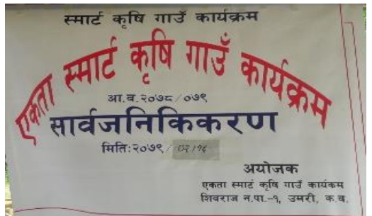
एकता स्मार्ट कृषि गाउँ कार्यक्रम, शिवराज न.पा. १ उमरी, कपिलवस्तुका झलकहर