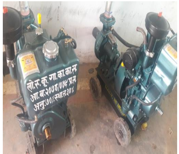
लोहरौला स्मार्ट कृषि गाउँ कार्यक्रम कपिलवस्तुका गतिविधिहरु