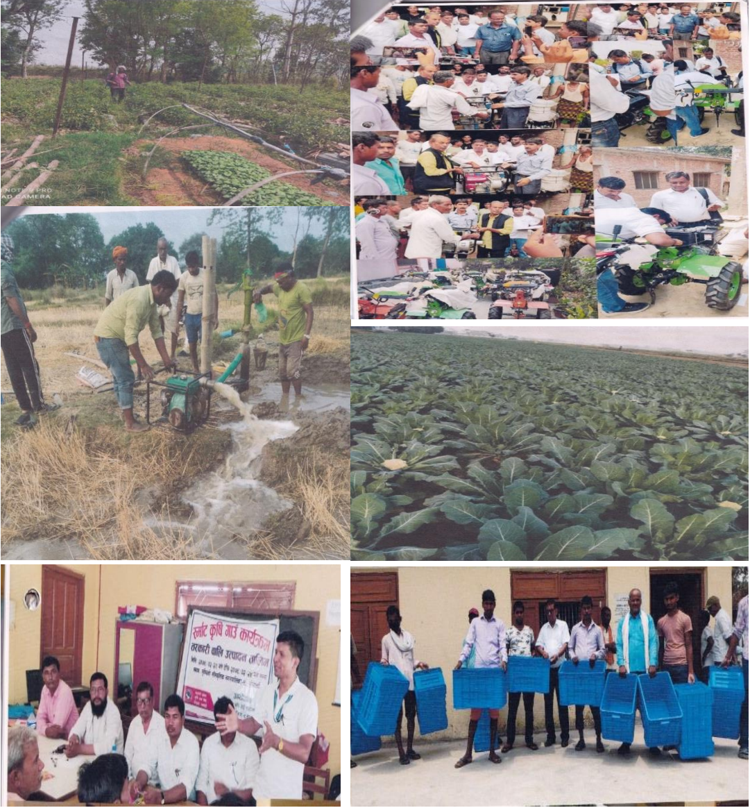
स्मार्ट कृषि गाउँ कार्यक्रम कार्यान्वयन समिति, लुम्बिनी सांस्कृतिक न.पा.-९, रुपन्देहीका झलकहरु