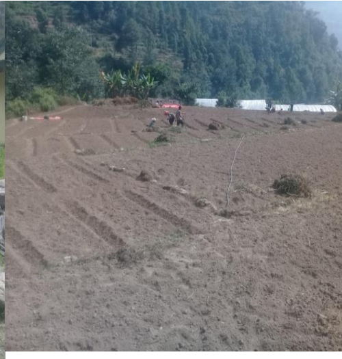
जेलबाड स्मार्ट कृषि गाउँ कार्यक्रम, सुनछहरी गा.पा. ७, मा भएका गतिविधिका झलक