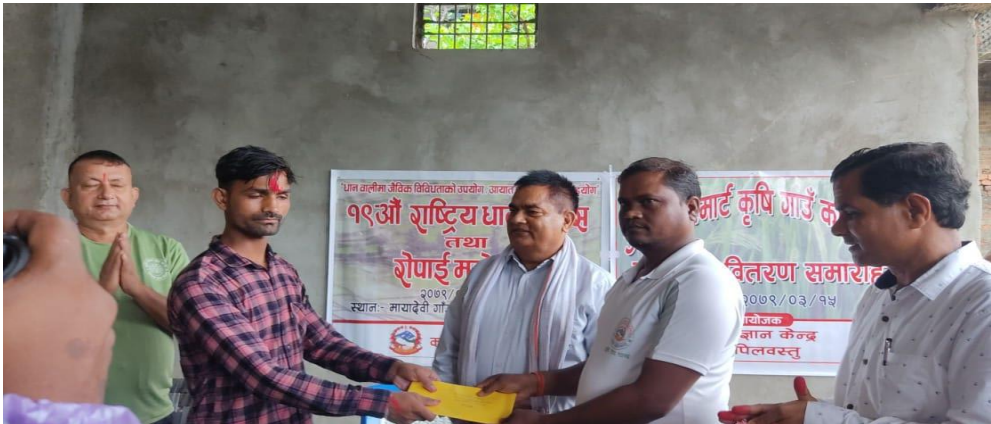
उत्कृष्ट स्मार्ट कृषि गाउँ पुरस्कार वितरण कार्यक्रम लोहरौला स्मार्ट कृषि गाउँ कृष्णनगर न.पा.-८