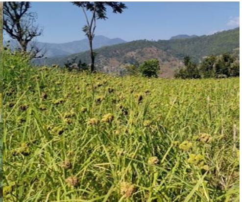
स्मार्ट कृषि गाउँ कार्यक्रम लुंग्री गा.पा., रोल्पाका गतिविधिका झलक