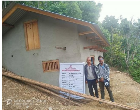
सिस्ने गा. पा. -७ र ८ स्यालापाखामा कार्यक्रम मार्फत निर्माण गरिएको सेलार स्टोर