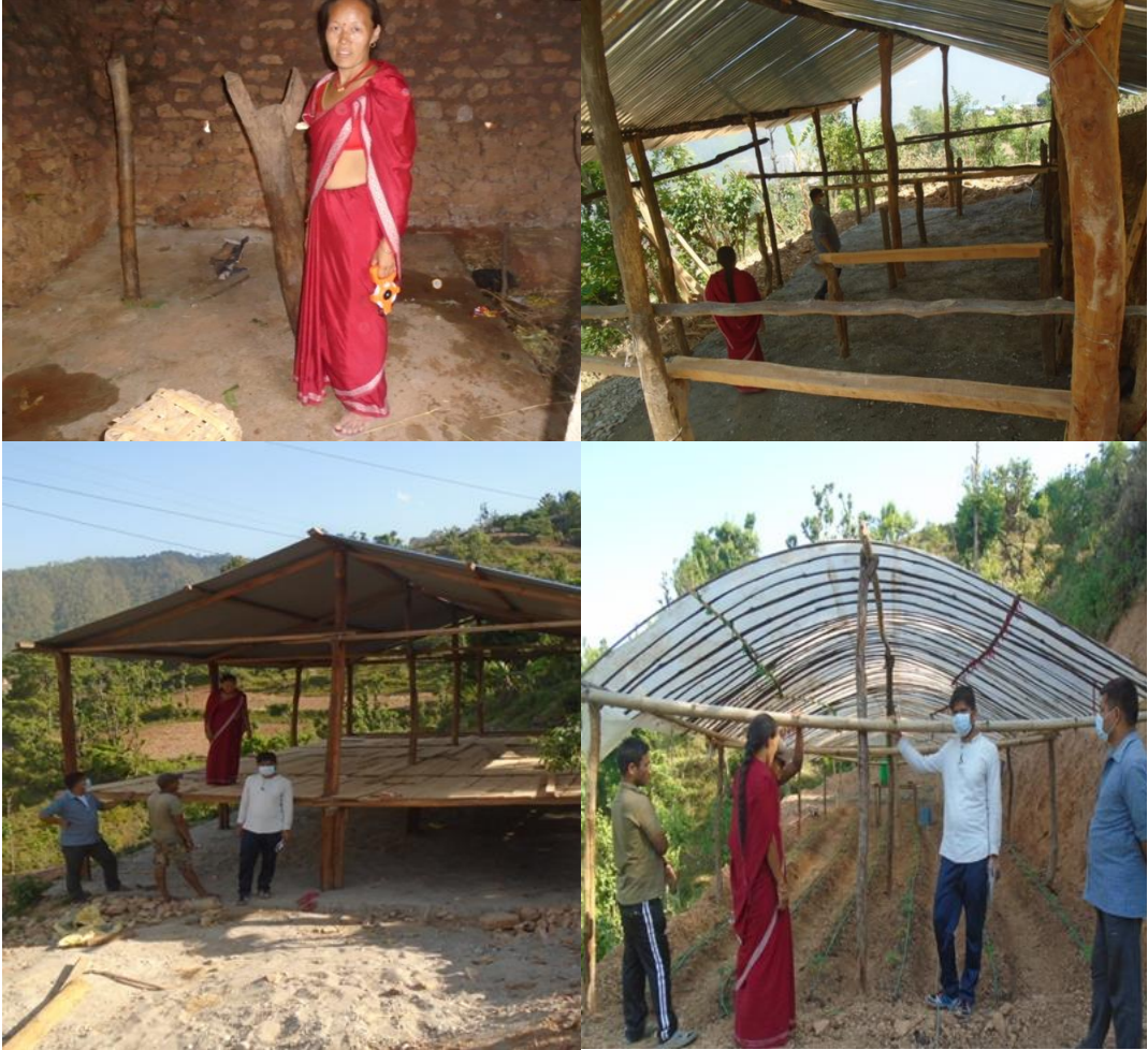
श्री घोडागाउँ स्मार्ट कृषि गाउँ कार्यक्रम, सुनिलस्मृति गा.पा.मा भएका गतिविधिहरु