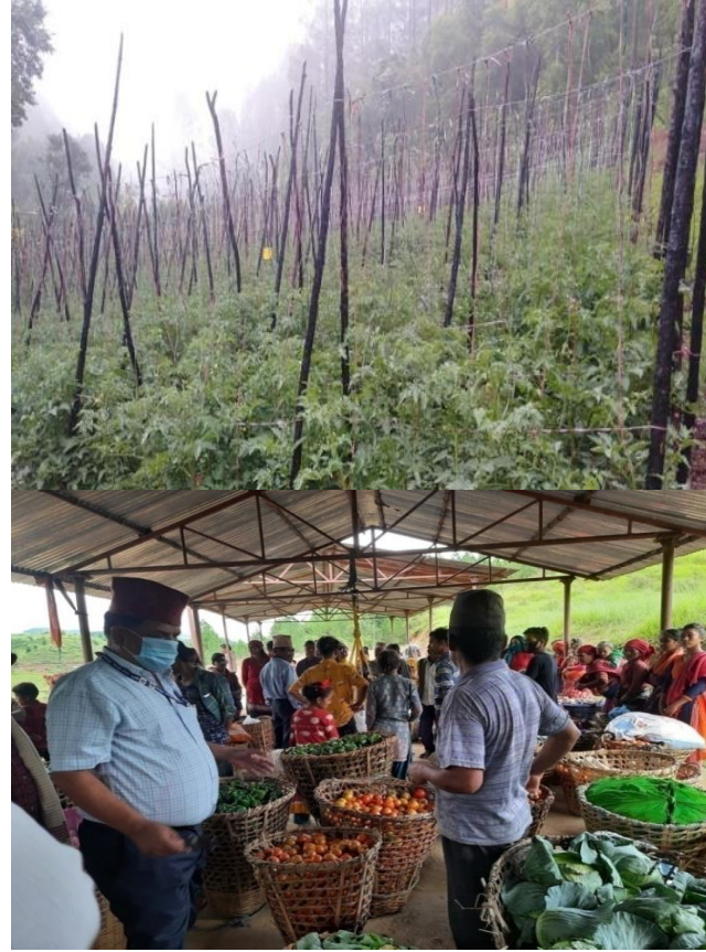
बुढागाउँस्मार्ट कृषि गाउँ कार्यक्रम, त्रीवेणी गा.पा.मा भएका गतिविधिहरु