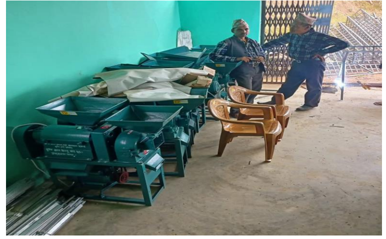
स्मार्ट कृषि गाउँ कार्यक्रम मालारानी गा.पा. ७ बामरुकका झलकहरू