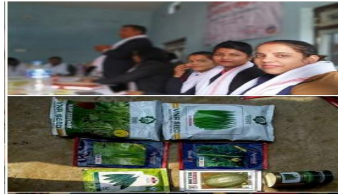
स्मार्ट कृषि गाउँ कार्यक्रम पालिनन्दन गा.पा. नवलपरासीका झलकहरु