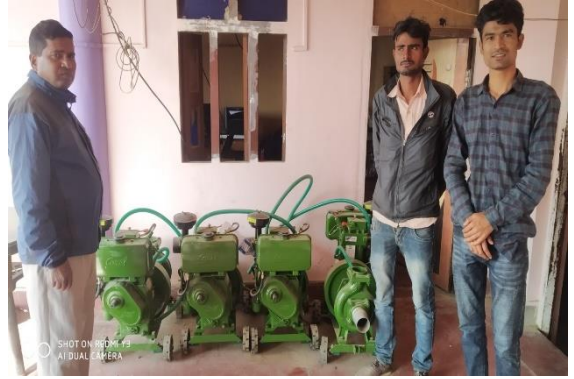
कोईली स्मार्ट कृषि गाँव कार्यक्रम कपिलवस्तुका केही झलकहरु