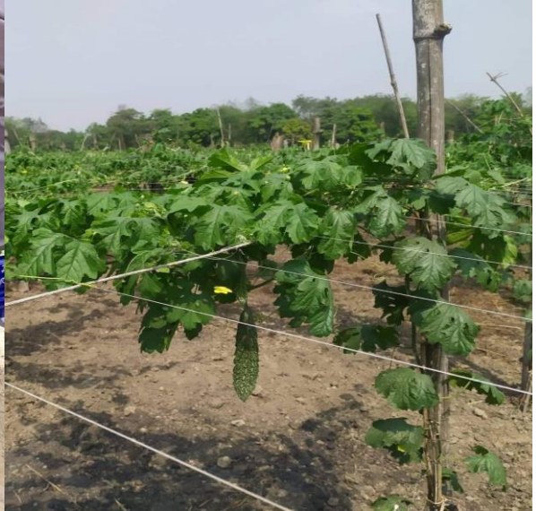
स्मार्ट गाँव कार्यक्रम कार्यान्वयन समिति, तिलोत्तमा न.पा.-१४, मंगलपूर, रुपन्देहीका झलहर