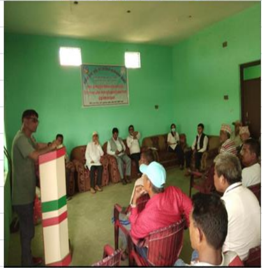
स्मार्ट कृषि गाउँ कार्यक्रम, बर्दघाट- न.पा.-२, धनेवा नवलपरासीका झलहरु