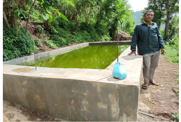
स्मार्ट कृषि गाउँ कार्यक्रम भूमिकास्थान न.पा. ३ खिलुराई खन्नेका झलकहर