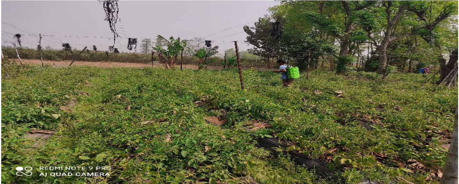
दोगहरी कृषि स्मार्ट गाँउ कार्यक्रम कार्यान्वयन समिति, सि.न.न.पा-१०, दोगहरी, रुपन्देहीमा व्यवसायिक तरकारी खेतीका दृश्यहरु