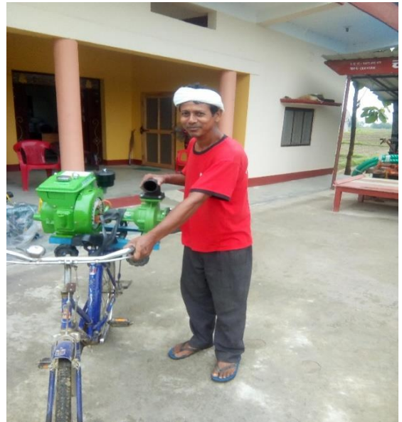
तरैनी कृषि स्मार्ट गाँउ कार्यक्रम कार्यान्वयन समिति, ओमसतिया गा.पा.-५, तरैनी, रुपन्देहीका गतिविधिहरुको दृश्यहरु