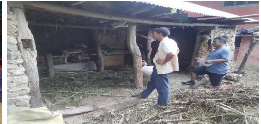
जनप्रिय स्मार्ट कृषि गाउँ कार्यक्रम मल्लरानी गा.पा.-२, प्युठानका झलकहरु