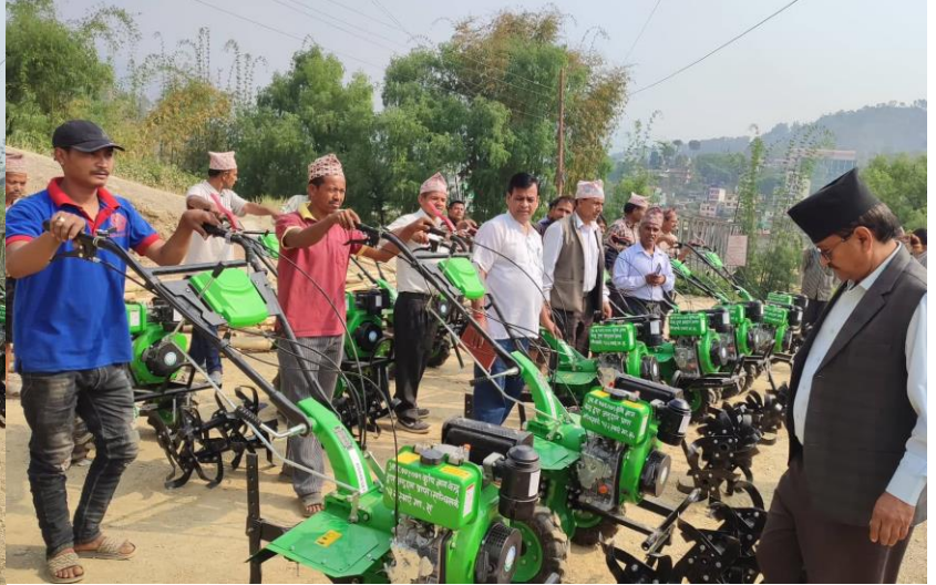
सन्धिखर्क स्मार्ट कृषि गाउँ कार्यक्रम सन्धिखर्क न.पा. १ र २का झलकहरु