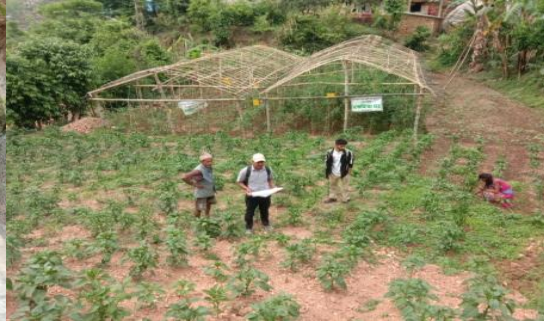
स्मार्ट कृषि गाउँ कार्यक्रम प्युठान न.पा. ९ र १० प्युठानका झलकहरु