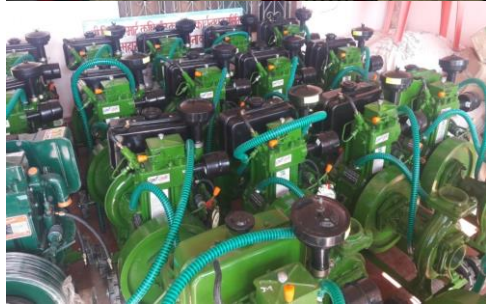
सौरहा स्मार्ट कृषि गाउँ कार्यक्रम कपिलवस्तुको झलकहरु